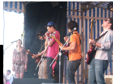
SortirBordeaux gironde-avril/mai 2008